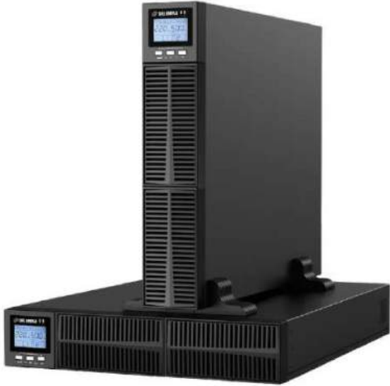
Rack Tower 1-3 kVA