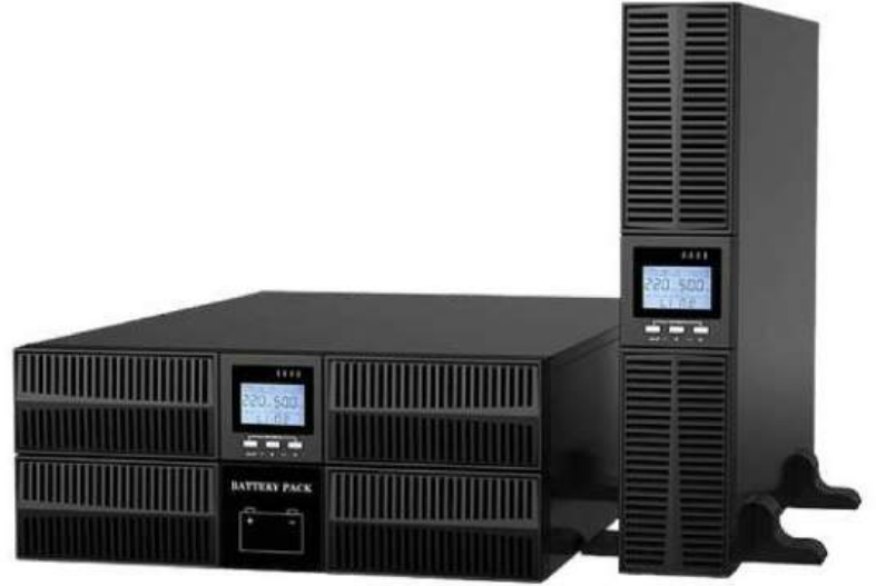
Rack Tower 6-10 kVA

*Ürün görselleri güç değerlerine göre değişiklik gösterebilir.